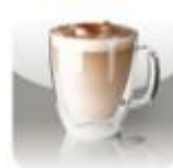
КОФЕ С МОЛОКОМ